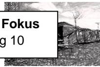
Jugendhaus Fokus Bolggärtenweg 10