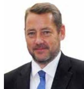
Uwe Ganzenmüller Bürgermeister